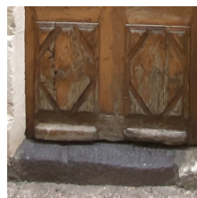
Seuil/marche, en pierre volcanique, dans l'embrasure

Les seuils sont le lien entre l'espace public et privé, leur traitement peut empiéter sur la rue mais ne doit pas empêcher le ruissellement des eaux de pluie. Ils seront de préférence en pierre dure, en béton bouchardé, ou habillés par une plaque en fonte.