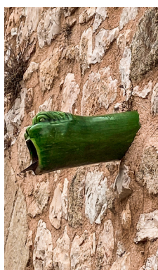
Pissette /déversoir en céramique vernissée