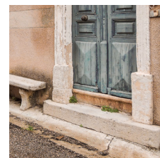
Seuil et marche en retrait du caniveau, en calcaire dur