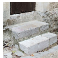
Marches sur le caniveau, en pierre froide