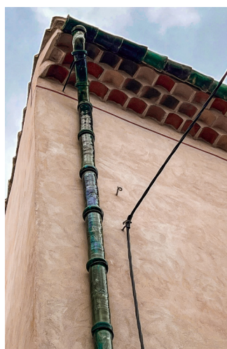
Chéneau et descente en céramique vernissée