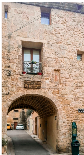
Paroi en moellons à pierres vues