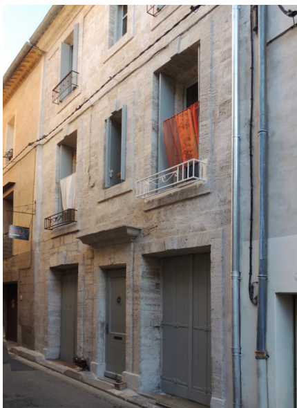
Paroi en pierre de taille