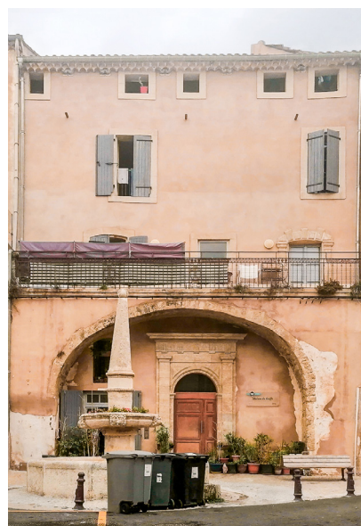
Paroi avec enduit et/ou badigeon